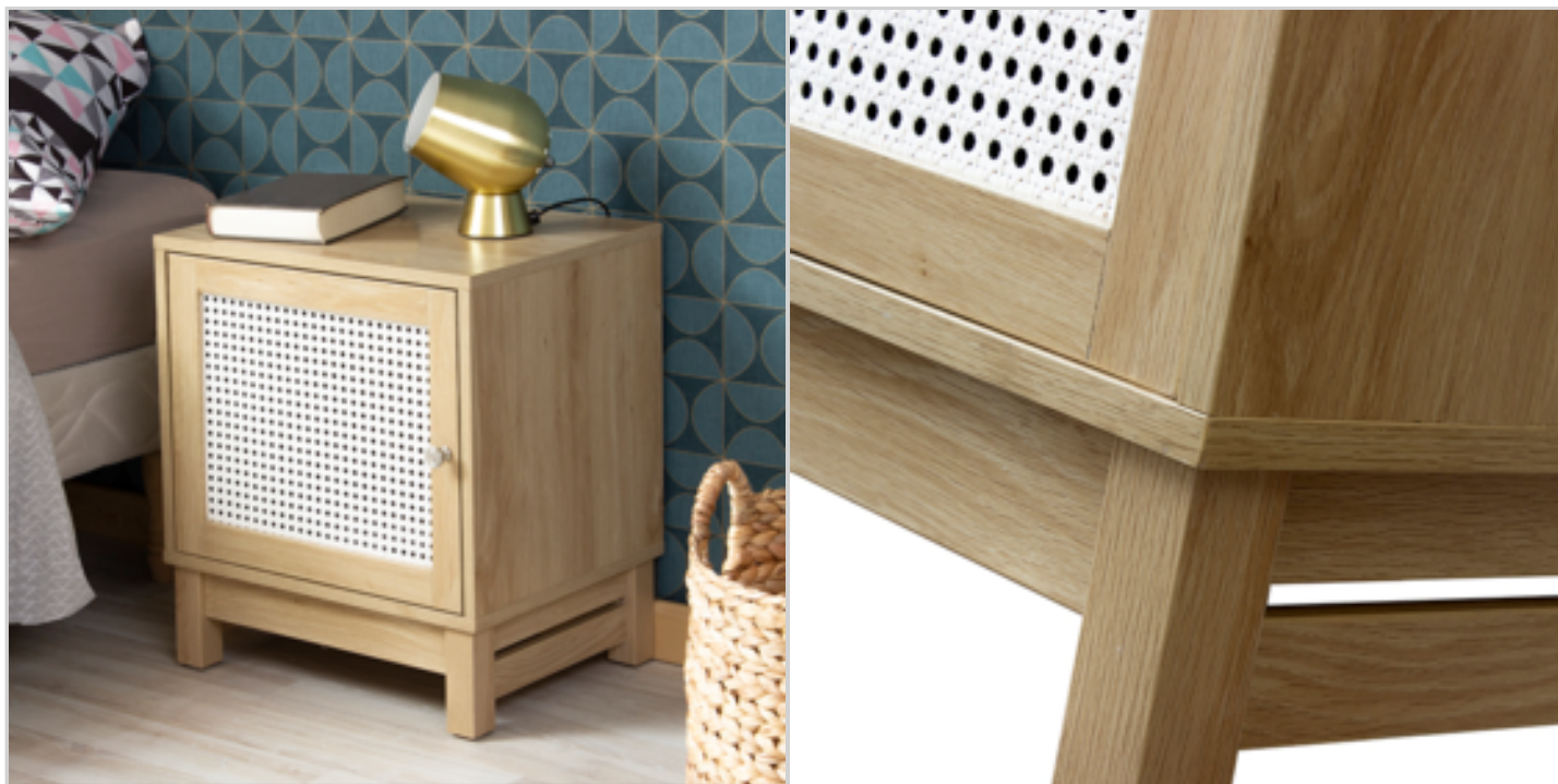
Table de chevet 1 porte avec charnières façade imitation rotin ECOPART : 0.47€ HT