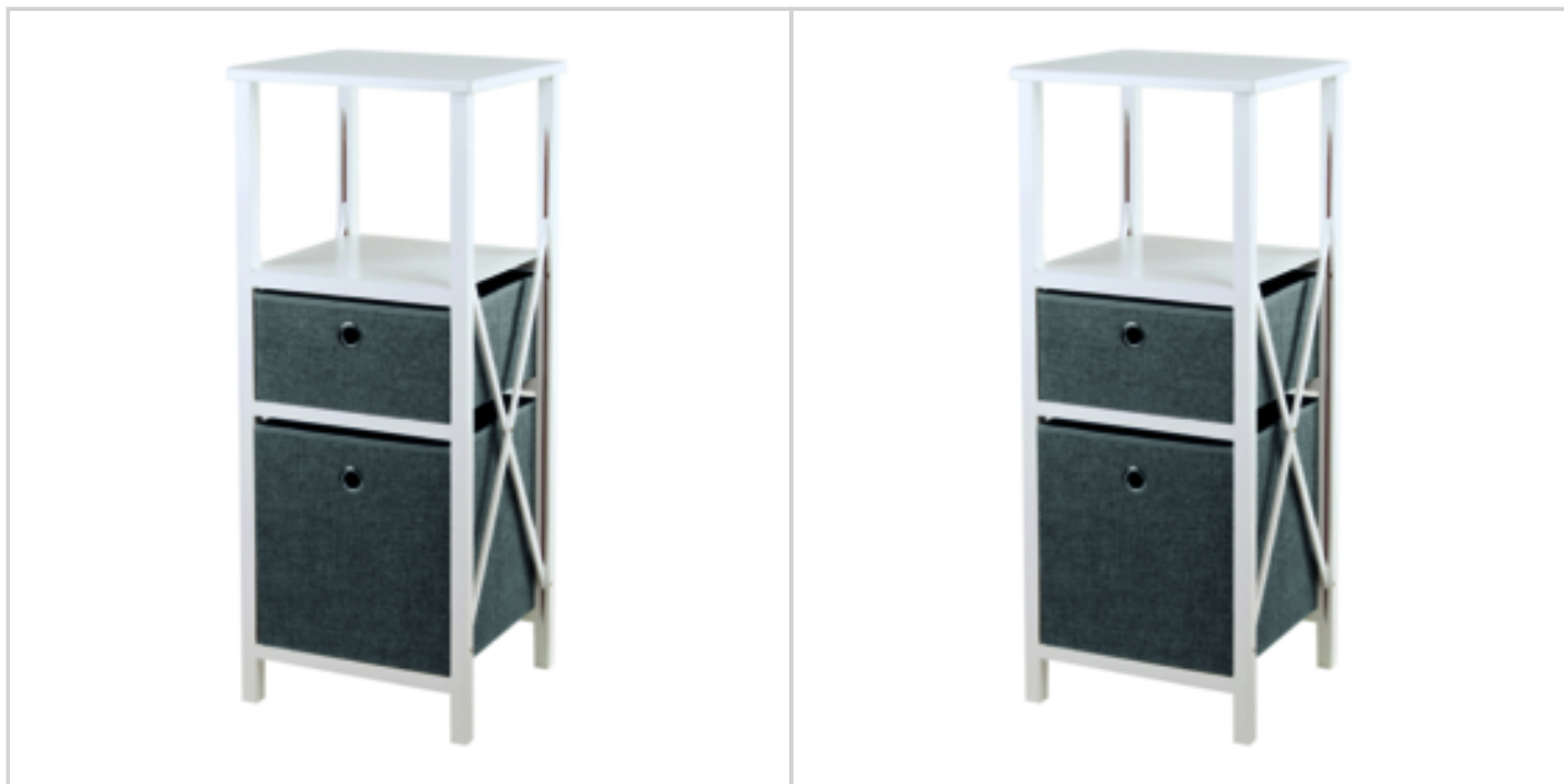
MEUBLE PLIABLE BLANC 2 TIROIRS GRIS